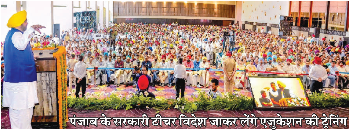
पंजाब के सरकारी टीचर विदेश जाकर लेंगे एजुकेशन की ट्रेनिंग

विदेश जाएंगे प्रिंसिपल... सीएम ने बड़ा ऐलान किया कि सरकारी स्कूलों के प्रिंसिपल 70 से 80 का ग्रुप बना विदेश में ट्रेनिंग लेने, वहां का एजुकेशन सिस्टम समझने को भेजे जाएंगे। मसलन, जिस देश का एजुकेशन सिस्टम बेहतर है, वहीं भेजेगा। वैसे अध्यापकों पर सरकार को पूरा है कि वे बच्चों को टॉपर बनाने का दम रखते हैं। बच्चों की जिंदगी में अध्यापक रोल मॉडल होते हैं। परेंट्स से ज्यादा बच्चों के बारे में उनको पता रहता है। मुख्यमंत्री बोले कि अभी पंजाब के शिक्षा क्षेत्र में काफी पीछे है। जरूरत डिजिटल शिक्षा स्तर पर जाने की है। स्कूल की इमारतें बनाने या रंग कराने से शिक्षा का स्तर