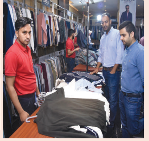
▶ होटल पार्क प्लाजा में विजिटर्स को रेजिनट की नई कलेक्शन दर्शाते कंपनी अधिकारी।