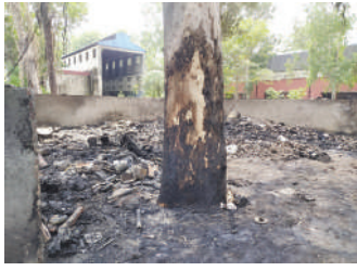
आग इतनी भीषण लगी थी कि पेड़ तक चपेट में आ गए, अगले दिन स्क्रेप यार्ड ऐसी हालत में नजर आया।

लुधियाना / यूटर्न / 10 मई। यहां रेलवे के डीजल शैड के साथ स्क्रेप यार्ड में घोर-लापरवाही के चलते भीषण आग लगने का मामला तूल पकड़ सकता है। विभागीय सूत्रों के मुताबिक इस मामले में रिपोर्ट मिलने के बाद उच्च स्तरीय जांच होनी है। ताकि यह पता लगाया जा सके कि यह हादसा लापरवाही के कारण हुआ या इसके पीछे कोई साजिश है। सूत्रों के मुताबिक इस हादसे को लेकर यह आशंका जताई जा रही है कि इसके पीछे इसलिए साजिश हो सकती है, क्योंकि डीजल शैड में पड़े कबाड़ की हेराफेरी और सबूत खुर्दबुर्द करने की कोशिश हुई हो। हालांकि यह तो